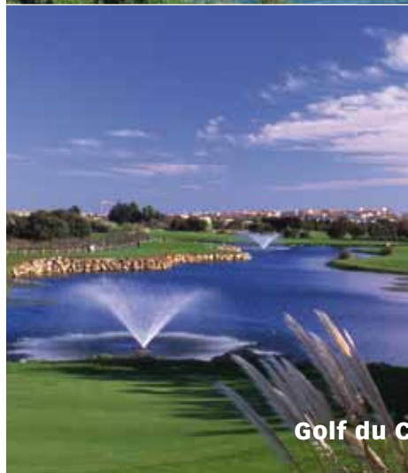
Golf du Cap d'Agde