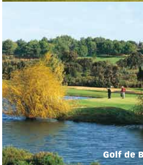
Golf de Béziers-Saint Thomas