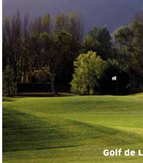
Golf de Lamalou-les-Bains

Office du Tourisme : 33 (0)4 67 95 70 91